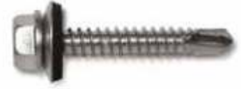
TJX (zincado azul)